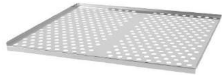
قابلیت قرار دادن سینی مشبک در صورت سفارش