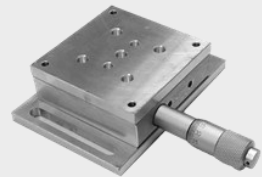
جابجاگر خطی دستی یک بعدی مینیاتوری

« محصولات مرتبط: جابجاگر خطی دستی یک بعدی و سه بعدی، نانوجابجاگر دستی، نانوجابجاگر پیزوالکتریک با فیدبک به همراه نرم افزار، جابجاگر موتوری میکرونی با فیدبک به همراه نرم افزار