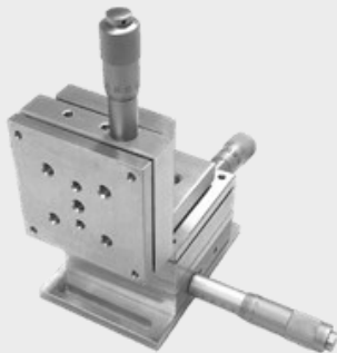
جابجاگر خطی دستی سه بعدی مینیاتوری