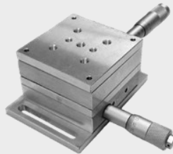
جابجاگر خطی دستی دو بعدی مینیاتوری