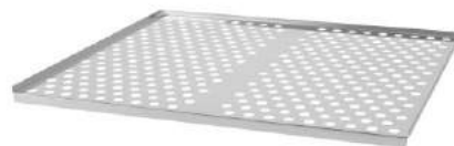
قابليت قرار دادن سيني مشبك در صورت سفارش