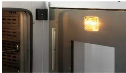
قابلیت نصب لامپ در صورت سفارش