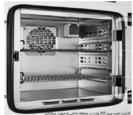
قابلیت نصب پرز 220 ولت در محفظه داخلی به صورت سفارشی