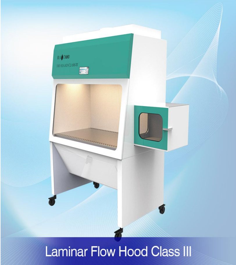
Laminar Flow Hood Class III