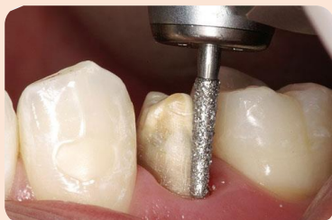
آموزش تراش و قالبگیری روکش ( پروتز ثابت)