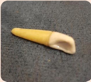
Mandibular Canine Incisor Tooth