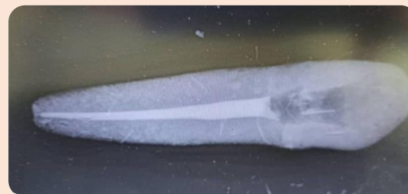
گرافی دندان کانین بعد از درمان ریشه