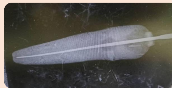
گرافی دندان کانین در حین درمان