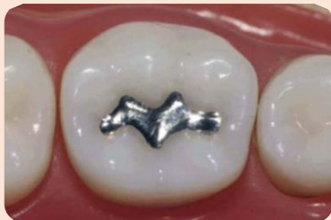
آموزش انواع مختلف آمالگام و کامپوزیت