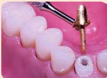
آموزش ساخت پست و روکش