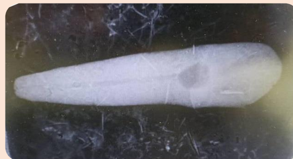
گرافی دندان کانین قبل از درمان ریشه