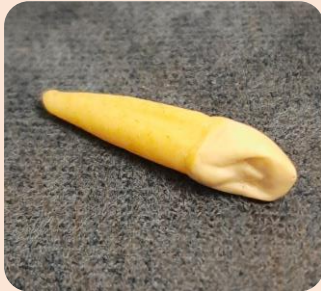
Mandibular First Premolar