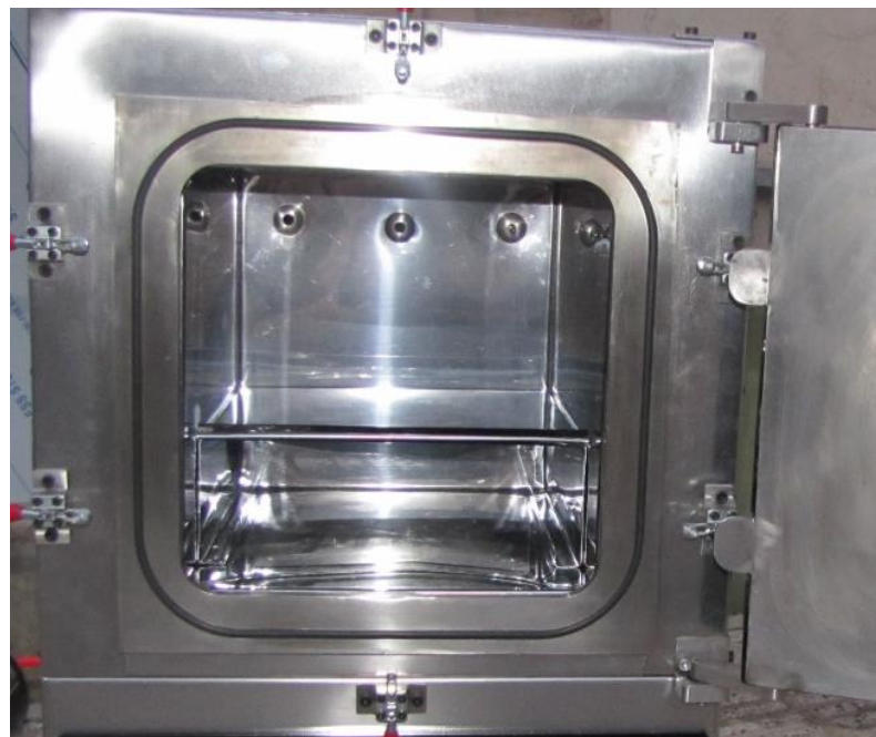
نمایی از کوره خلا دما بالا با سپر های تشعشعی داخلی