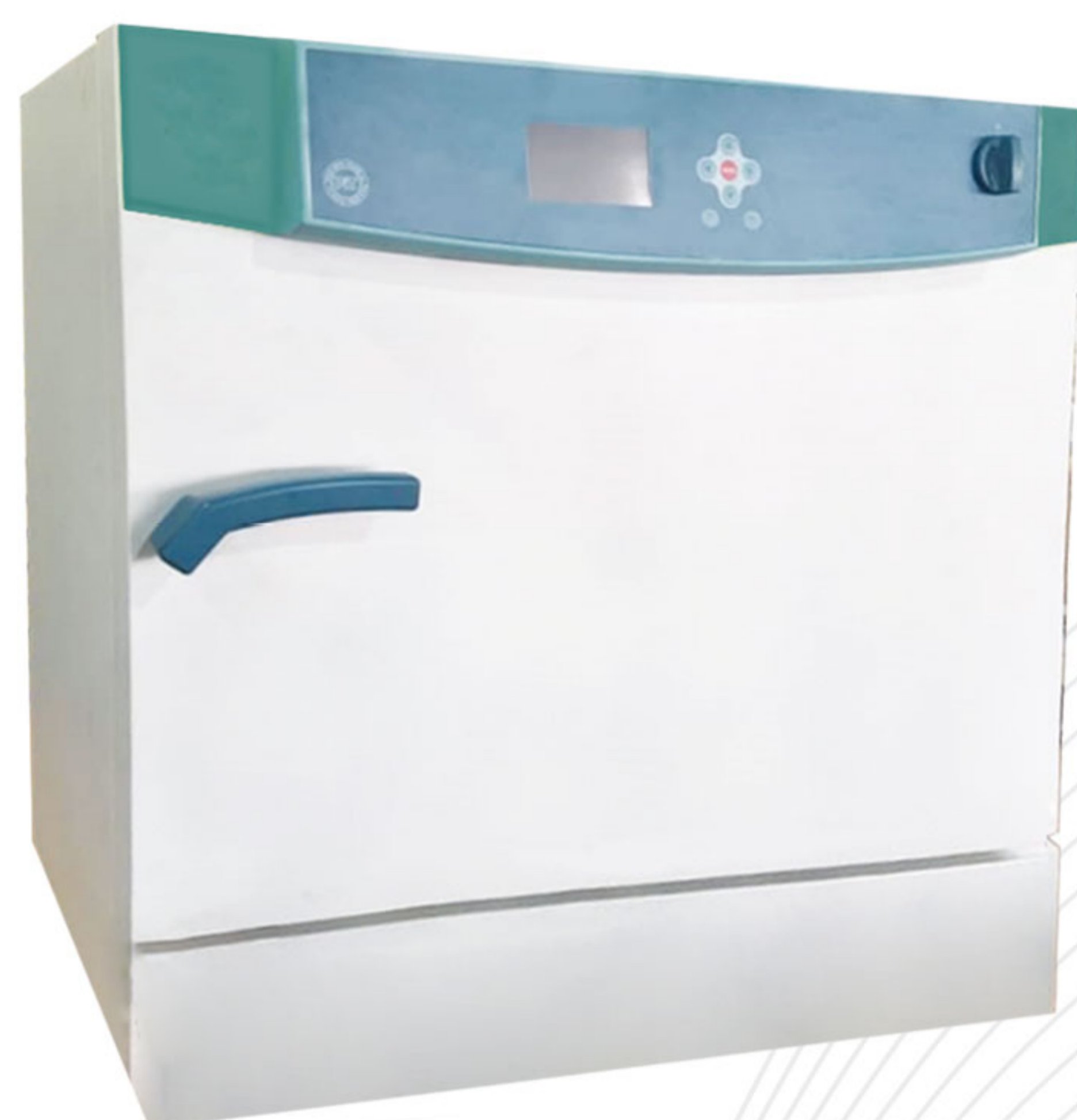
مدل یخچال دار