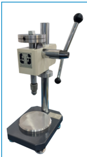
پایه سختی سنج شور A و D