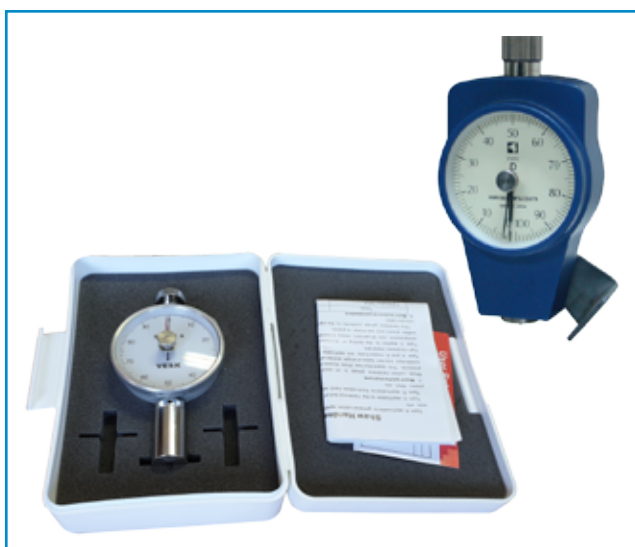
ساعت سختی سنج شور A و D