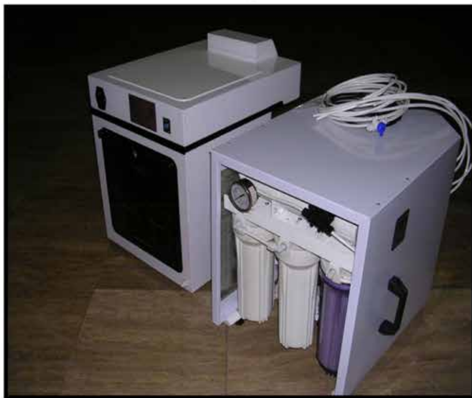
نمای پشتی دستگاه