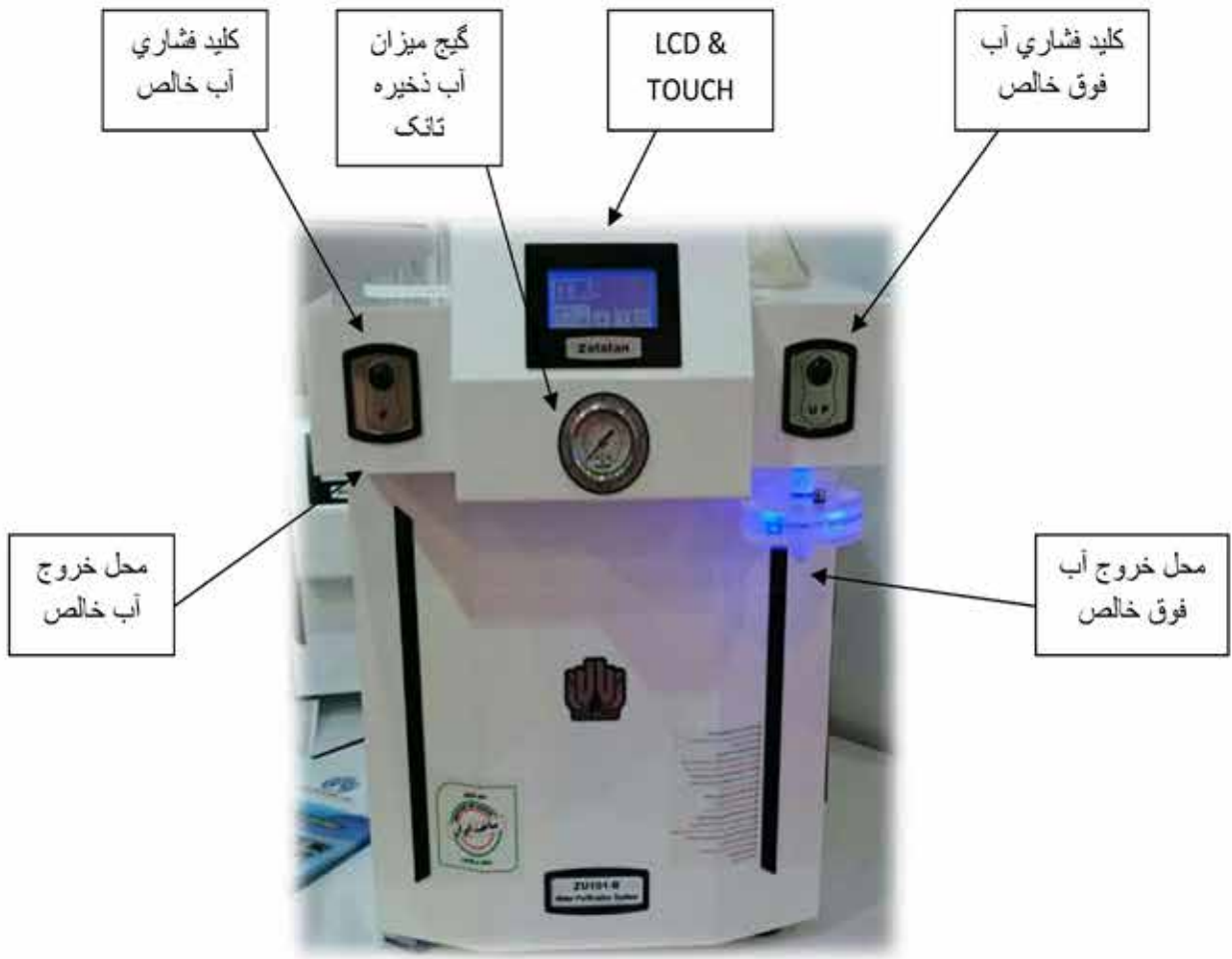
نمایی کلی از LCD & TOUCH نمایشی دستگاه