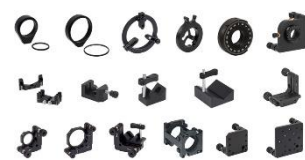
کیت کامل نگهدارنده های اپتیکی