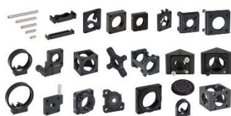
کیت کامل قفس اپتیک

مشاهده صفحه این محصول در سایت شرکت پلاریتک