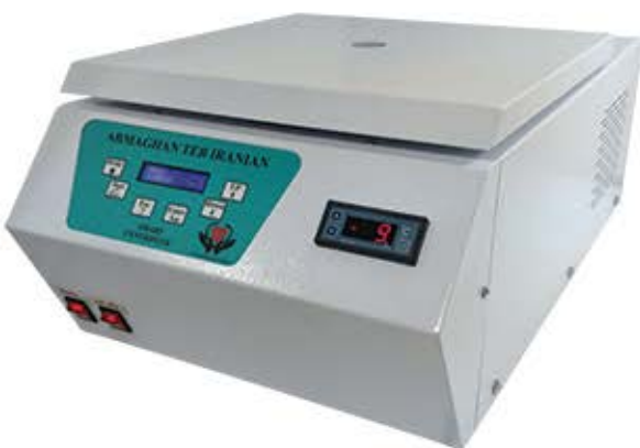
سانتریفیوژ (میکروفیوژ) یخچال دار ۱۴۰۰۰ دور در دقیقه