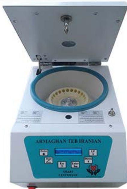
سانتریفیوژ (میکروفیوژ) ۱۴۰۰۰ دور در دقیقه ۲۴ شاخه