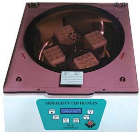
سانتریفیوژ ۱۶ شاخه ۴۰۰۰ دور در دقیقه