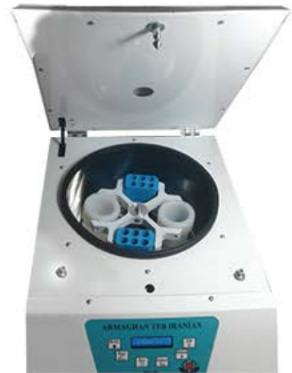
سانتریفیوژ ۲۴ شاخه ۴۰۰۰ دور در دقیقه