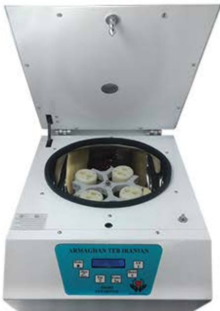
سانتریفیوژ ۴-۸-۱۶ شاخه ۴۰۰۰ دور در دقیقه مخصوص لوله های ۱۵ ال پی آر پی