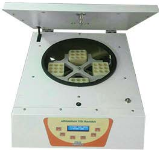
سانتریفیوژ ۳۶ شاخه ۴۰۰۰ دور در دقیقه