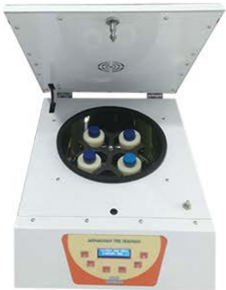
سانتریفیوژ ۴ شاخه ۴۰۰۰ دور در دقیقه مخصوص لوله های فالکون ۵۰ سی سی