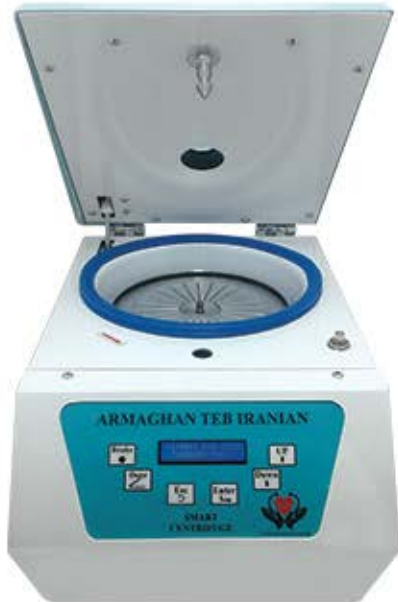
میکروهماتوکریت ۱۲۰۰۰ دور در دقیقه