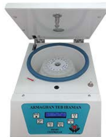
سروپیوژ ۱۸ شاخه ۳۰۰۰ دور در دقیقه