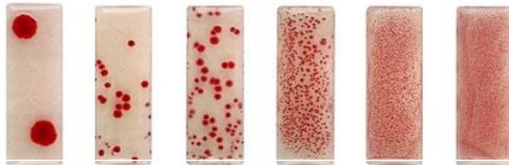
تعداد تقریبی کلنی باکتری در ۱۰۰ میلی لیتر (از چپ به راست): ۱۰۰، ۱۰۰۰، ۱۰۰۰۰، ۱۰۰۰۰۰، ۱ میلیون و بالاتر از ۱ میلیون