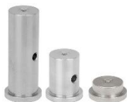
میله استیل پایه ستونی

مشاهده صفحه این محصول در سایت شرکت پلاریتک