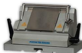
نگهدارنده اهرمی تیغ