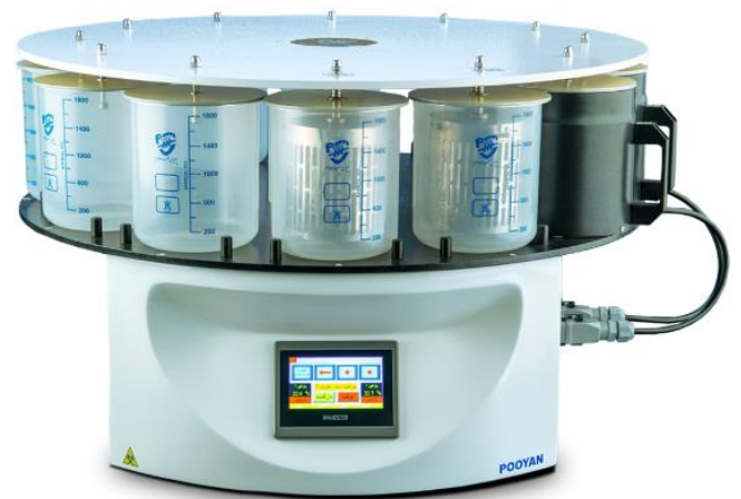
پردازشگر بافت پویان