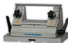
مخصوص هلدرتیغ های یکبار مصرف و تیغ های دائمی