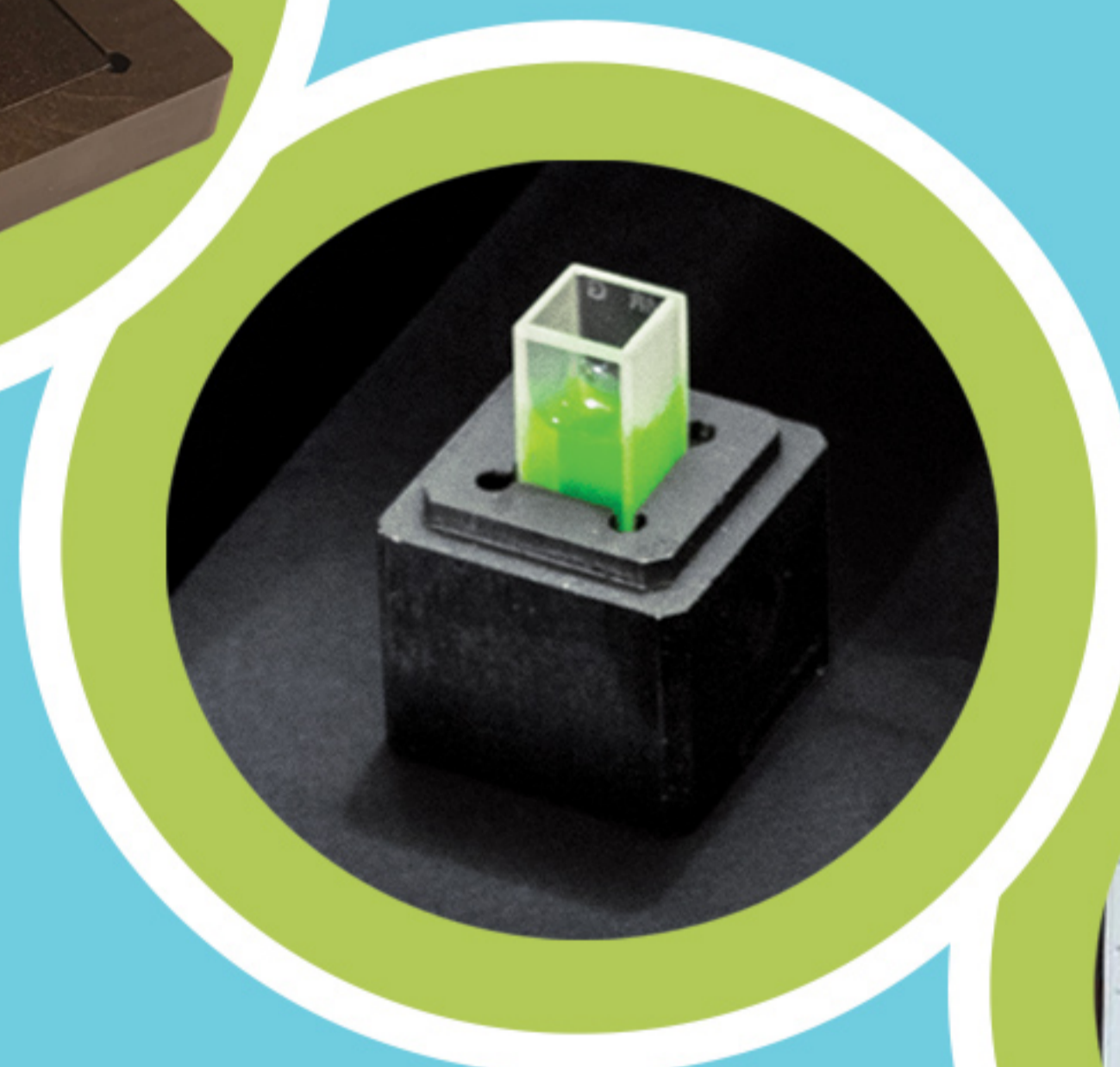
اندازه گیری کووت