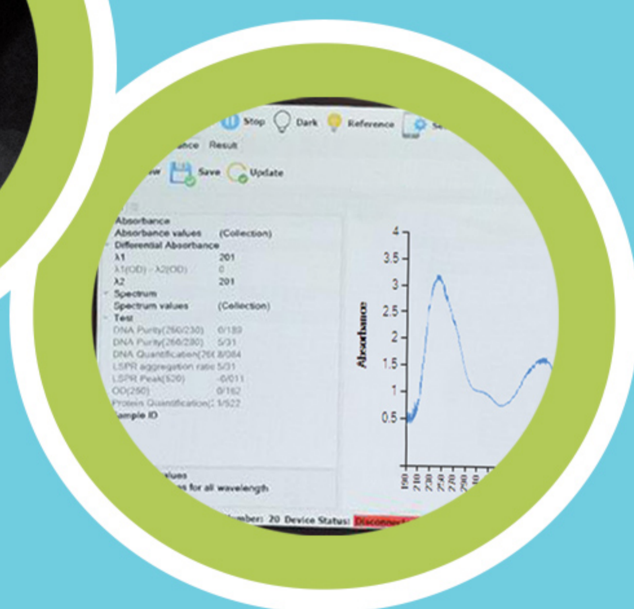
اندازه گیری سریع