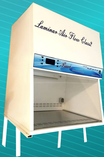
هود لامینار کلاس ۲