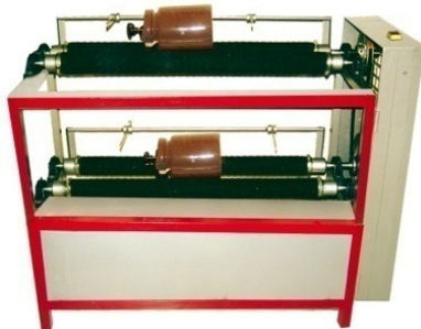
کد: JMD-C .....دور ثابت