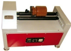
کد: JMS-2C .....دور ثابت