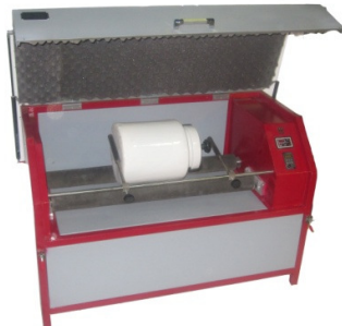
کد: JMS-3C .....دور ثابت