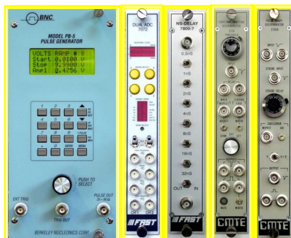
شکل (۲) چند مدول استاندارد از شرکت Fastcomtec

آشکارسازهای امروزی اطلاعات گوناگونی در مورد تابش آشکار شده را به شکل علامت الکتریکی نشان می دهند. به منظور استخراج این اطلاعات باید علامت توسط یک سیستم الکترونیکی تحلیل شود. این سیستم می تواند طوری طراحی شود که کارهای بسیار متفاوتی انجام دهد. برای مثال جداکردن علامت های مشابه، استخراج اطلاعات انرژی، تعیین زمان نسبی بین دو علامت و ده ها مورد دیگر از این نوع است. سیستم های الکترونیکی که در آزمایش های فیزیک هسته ای و فیزیک ذرات بکار می روند تشکیل دهنده شاخه ای الکترونیک هسته ای می باشند و امروزه به نحو گسترده ای به شکل مدول هایی استاندارد شده اند به عنوان نمونه مدارهایی که برای توابع تحلیلی پایه بکار می روند ( تقویت کننده ها، تبعیض گرها، . . . ). این مدولها به صورت واحدهای الکترونیکی جدا از هم با استانداردهای مکانیکی و الکترونیکی مشخص ساخته شده اند [۱].