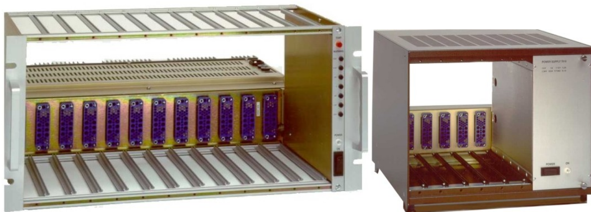
شکل (۲ ۴) دو نمونه بین استاندارد (NIM BIN) با عرض استاندارد.

اولین و ساده ترین استاندارد که برای فیزیک هسته ای و فیزیک انرژی زیاد بنیان شده است سیستم با قطعات جدا از هم، به نام NIM می باشد مدول های این سیستم دارای عرض استاندارد حداقل برابر 1.35 اینچ (3.43 cm) و ارتفاع 8.75 اینچ (22.25 cm) می باشند. همچنین از لحاظ عرض می تواند به فرم های دو برابر، سه برابر و... عرض استاندارد نیز ساخته شود. تغذیه این مدول ها از طریق اتصالاتی که در پشت مدول می باشد انجام می گیرد. این مدول ها برای تغذیه در بین های (bin) استاندارد قرار می گیرند هر بین می تواند بیش از ۱۲ مدول با عرض استاندارد را در خود جای دهد.