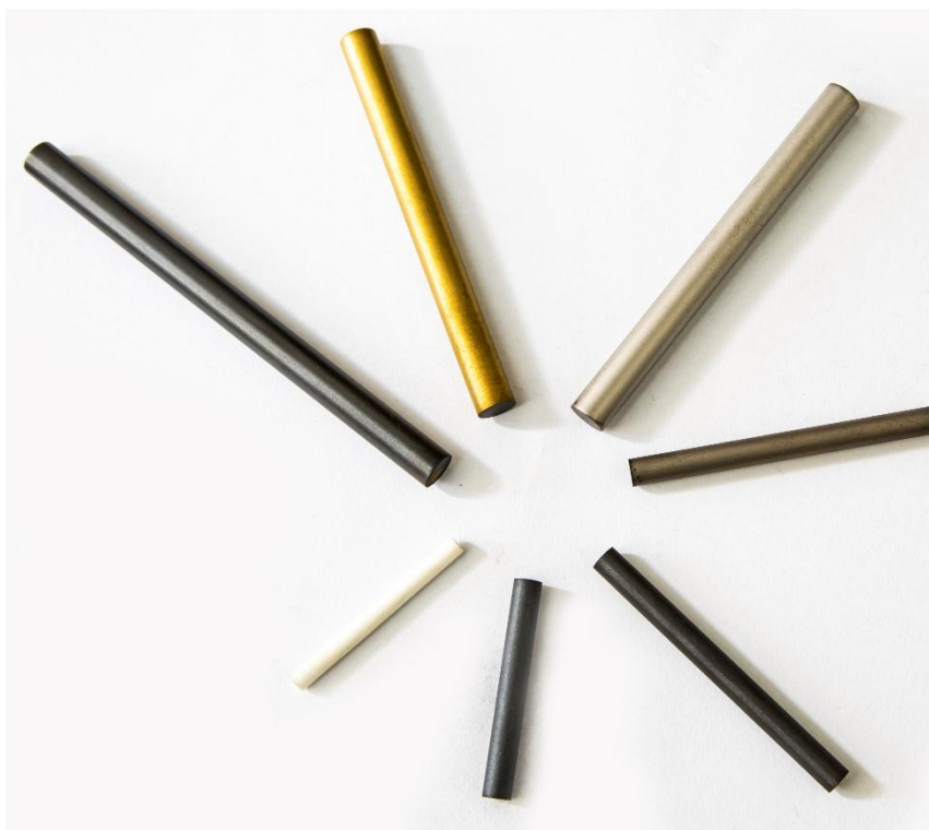
میله‌های فریتی تولیدی.