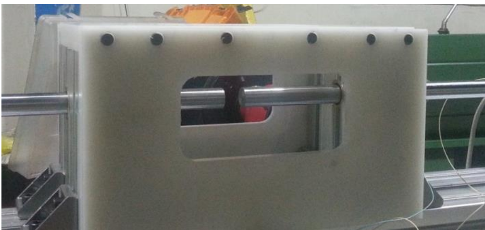
نمایی از اتاقک محافظ در دستگاه هایپکینسون بار فشاری