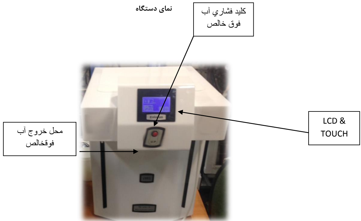
نمایی کلی از LCD & TOUCH نمایشی دستگاه