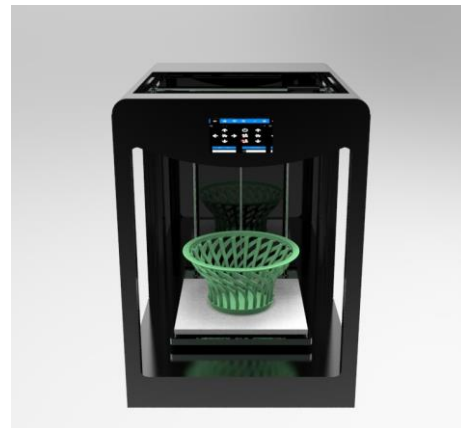
CF10 – 3D Printer