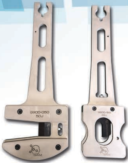
Charphy Testing Hammer