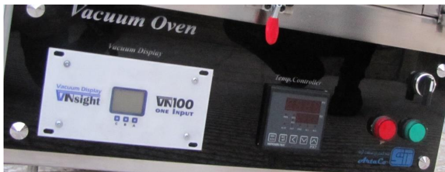
نمایش کنترلر کوره

این کوره دارای یک سیستم کنترلی منحصر بفرد می باشد. این ویژگی به منظور توسعه قابلیت های کوره، کم کردن محدودیت ها و به طور کلی بالا بردن کیفیت خدمات اضافه شده است.