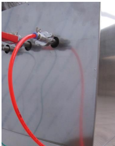
محل نصب پمپ خلا در پشت آون

بسته به محدوده خلا مورد نیاز، پمپ خود را انتخاب کرده و به همراه محصول سفارش دهید. به همراه پمپ دفترچه راهنمای سازنده که راه کار استفاده از آن را دارد، به شما ارائه می گردد که باید به خوبی آن را مطالعه نمایید. اتصال پمپ خلا به محفظه آون، از سمت پشت آون و با اتصال استاندارد خلا فراهم شده است.