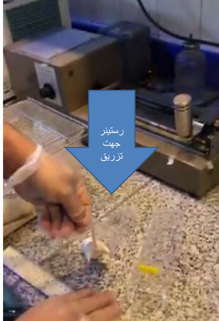
رستینر جهت تزریق