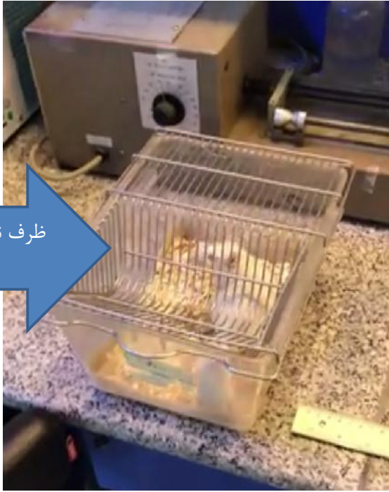
ظرف نگهداری موشو رات