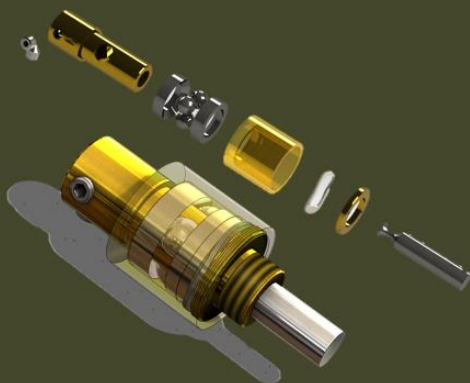
گیربکس سایکلوئید فوق دقیق بدون لقی