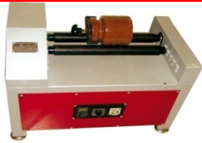
کد: JMS-1 .....