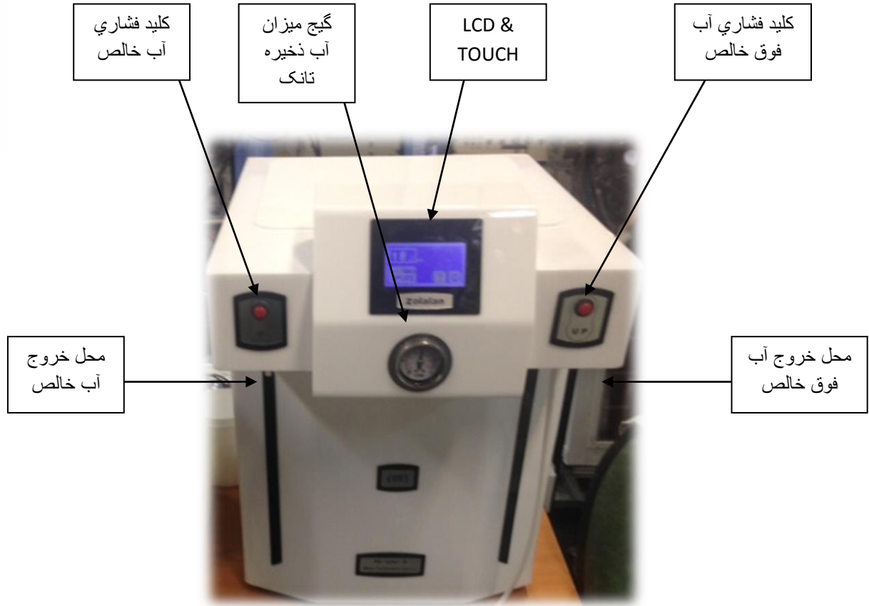
نمایی کلی از LCD & TOUCH نمایشی دستگاه