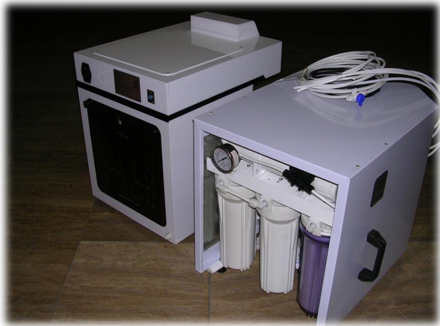
نمای پشتی دستگاه