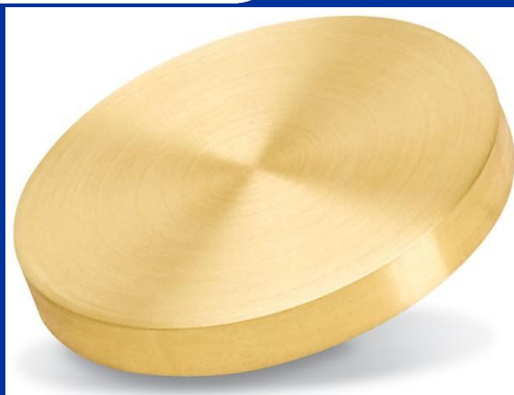
تارگت طلا با خلوص ۹۹.۹۹

تصاویر زیر برخی تارگت های تولید شده توسط شرکت را نشان می دهد