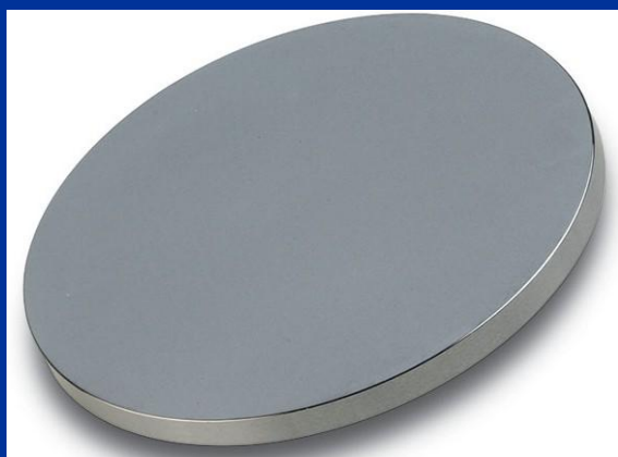
تارگت سیلیکون با خلوص ۹۹.۹۹۹