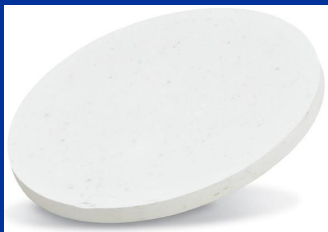
تارگت ZnS با خلوص ۹۹.۹۹

Trust Us! Design, Quality, Price, After Sale Service