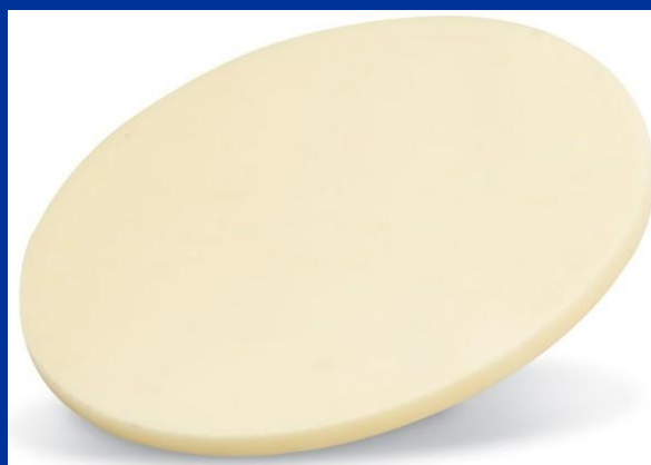
تارگت اکسید روی با خلوص ۹۹.۹۹