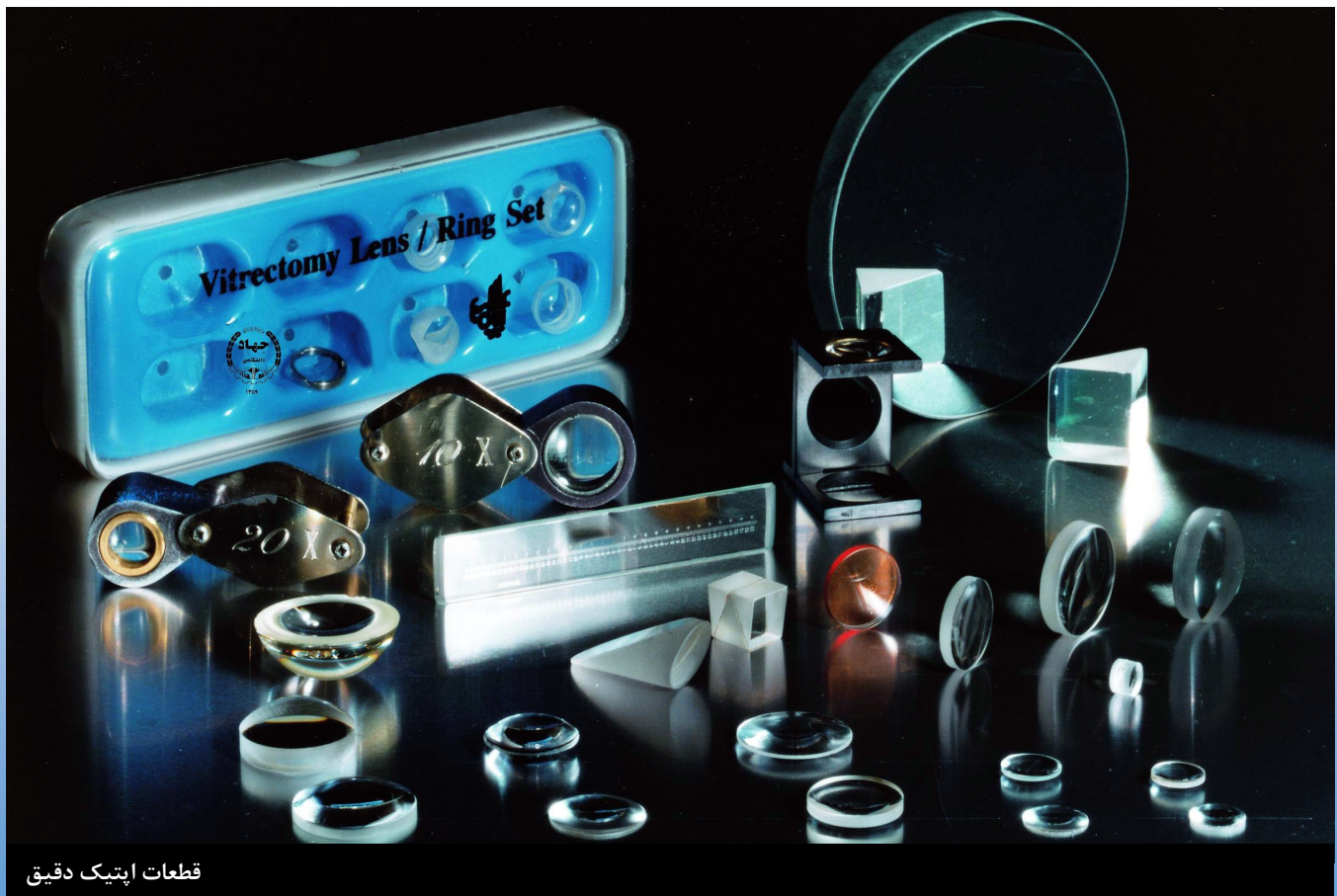
قطعات اپتیک دقیق