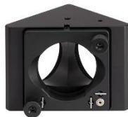
نگهدارنده اپتیکی قفس اپتیکی ۳۰ میلی متری

مشاهده صفحه این محصول در سایت شرکت پلاریتک