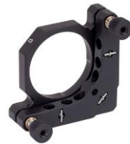
نگهدارنده اپتیکی قابل تنظیم ۲ اینچ