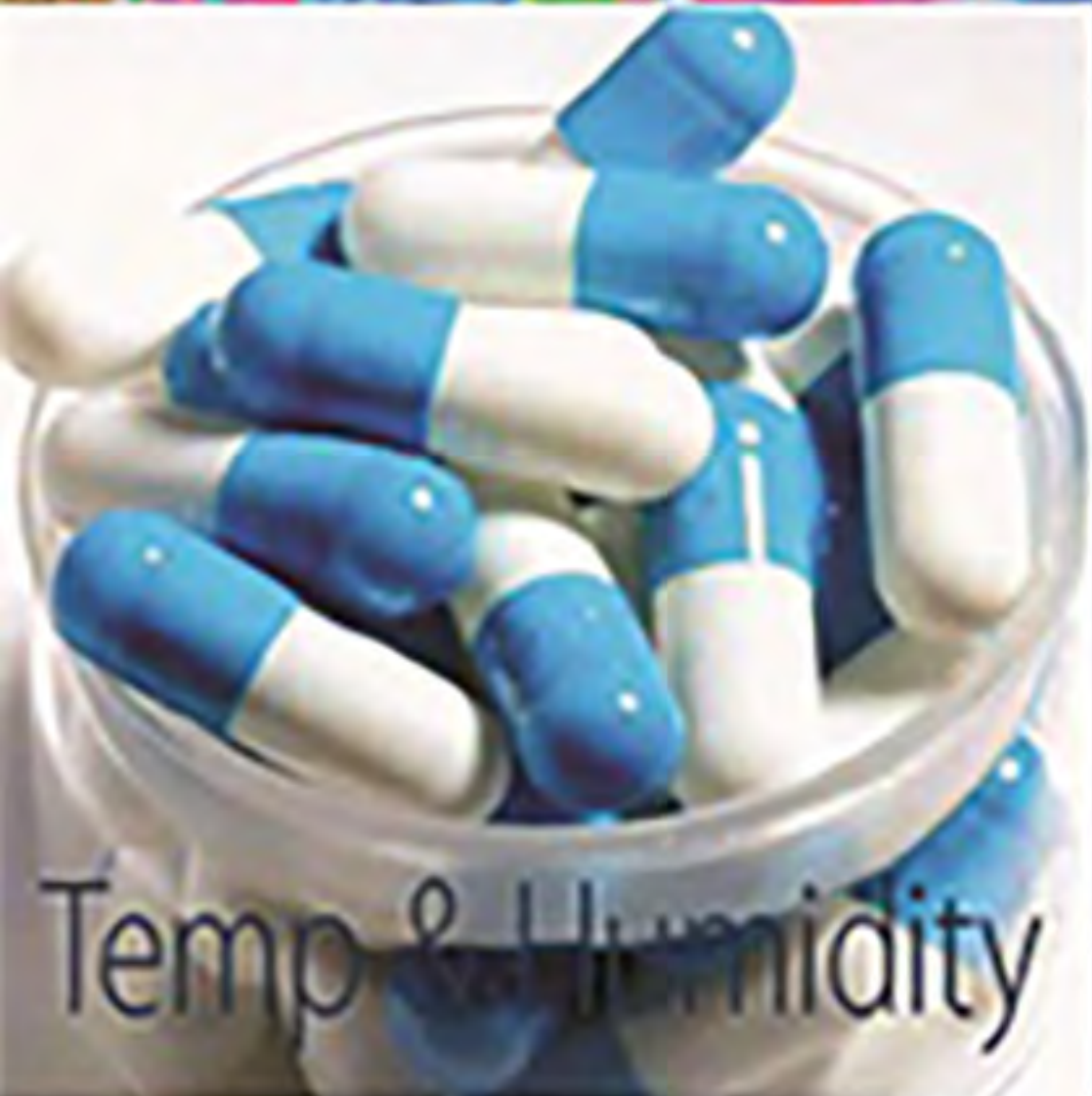
Temp & Humidity