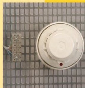
مجموعه‌ی آموزش سیستم اعلام حریق ۳