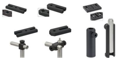
کیت گیره، نگهدارنده میله و پایه

مشاهده صفحه این محصول در سایت شرکت پلاریتک