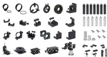
کیت کامل قطعات اپتومکانیکی