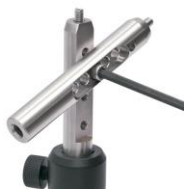
میله های استیل پیکربندی

مشاهده صفحه این محصول در سایت شرکت پلاریتک