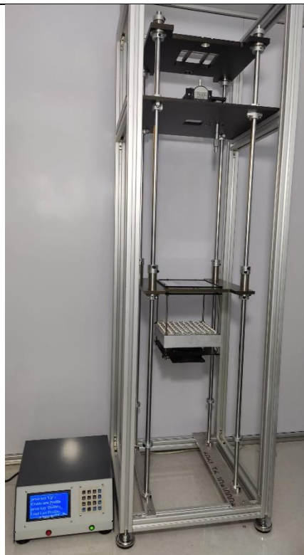
KAL5,7 با ضریب متغیر