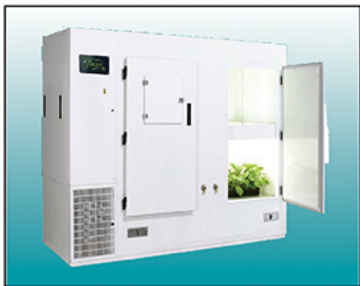
Seed Germination Chamber / X680