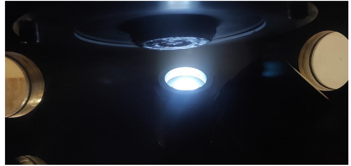
نمای از ایجاد پلاسما بر روی کاتد