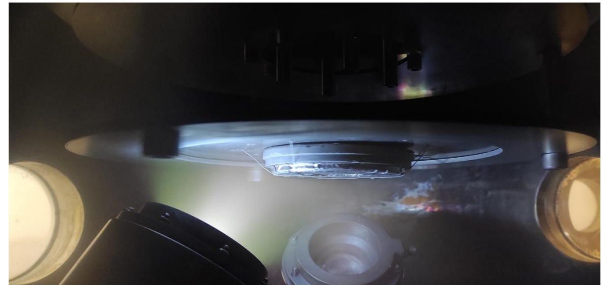
نمای از کاتد در درحال لایه نشانی