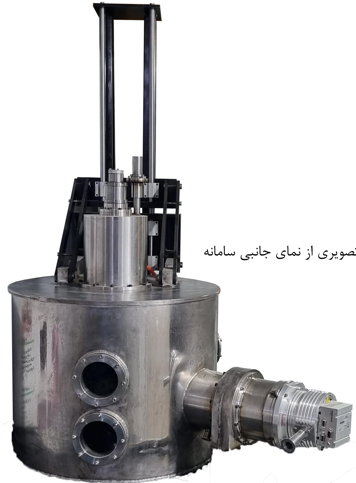
تصویری از نمای جانبی سامانه