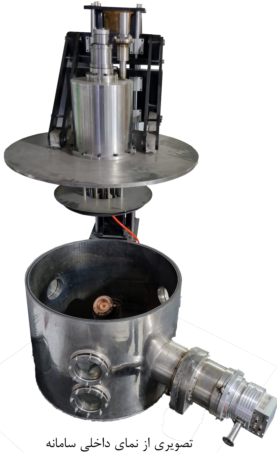
تصویری از نمای داخلی سامانه