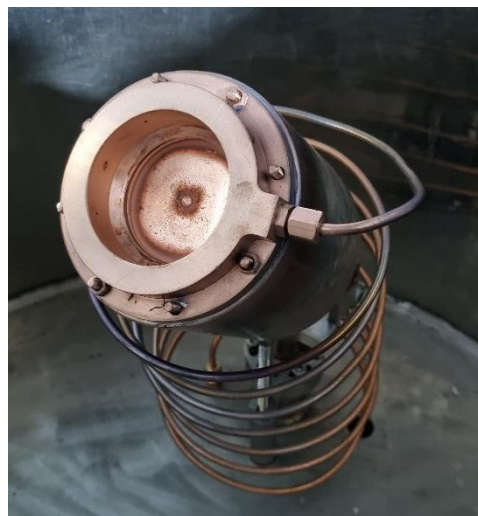
نمای از مسیر برداشت پلاسما از تارگت مس و اتصال لوله‌ی اتصال گاز آرگون به حلقه تزریق گاز کاتد