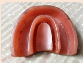
کست با قابلیت ماند کردن دندان