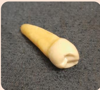
Molar Mandibular Posterior Tooth