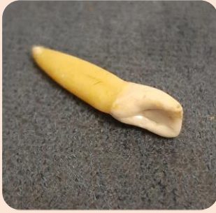
Lateral Mandibular Incisor Tooth