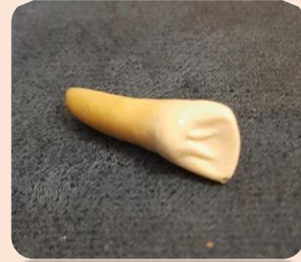
Lateral Maxillary Incisor Tooth