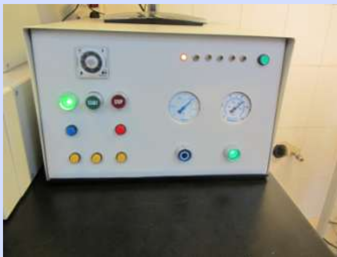
جعبه مدارات فرمان دستگاه تطبیق ماسک

در شکل‌های زیر جعبه کنترل و مدارات فرمان دستگاه دیده می‌شود. همچنین میز نگهدارنده نمونه و نمای جانبی دستگاه نیز در شکل‌های بعدی قابل مشاهده است. تمامی طراحی‌ها و سیستم کنترلی بکار رفته در این دستگاه توسط سازندگان داخلی و برای اولین بار در کشور انجام شده است. لازم بذکر که سازندگان دستگاه (شرکت توسعه فناوری ریز مقیاس آژینه) موفق به اخذ تاییده علمی این دستگاه برای ثبت اختراع گردیده‌اند و در چند ماه آینده برای اولین بار در کشور این اختراع را ثبت خواهند کرد.