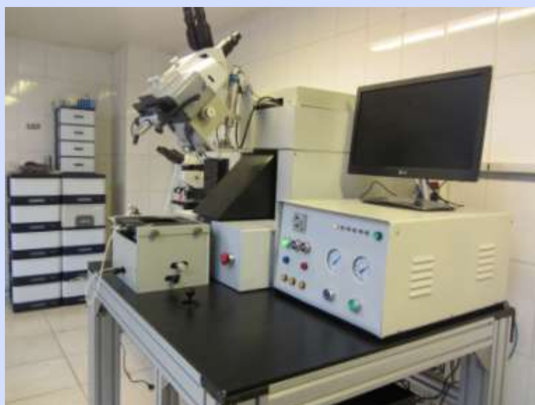
نمای جانبی دستگاه تطبیق ماسک