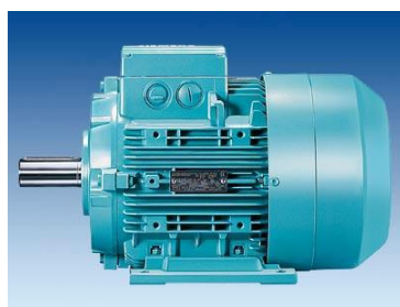
▪ AC Motor

✓ جهت نمایش و بررسی نحوه عملکرد موتورها در صنعت