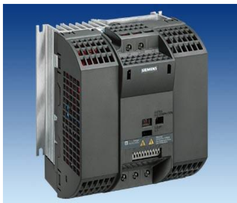
درايو Micro Master 420 يو