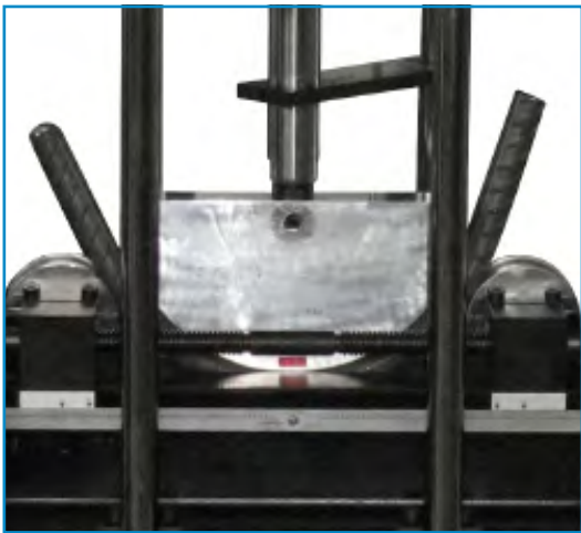
فک خمشی دستگاه خمش ۲۰ تن