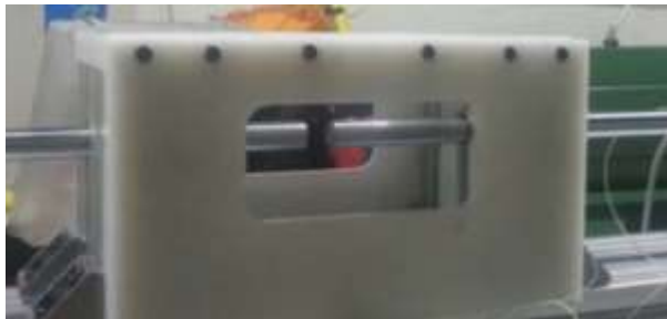
نمایی از اتاقک محافظ در دستگاه هایپکینسون بار فشاری