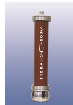
۹. دیود (D)

ولتاژ ضربه = 140 [kV] قطر گوی = 100 [mm] حداکثر فاصله گوی = 80 [mm] وزن = 8.6 [Kg]