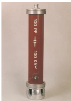
۸. خازن اندازه گیری (CM)

کاربرد: در مدار AC، به عنوان خازن مقسم ولتاژ AC استفاده می شود. مشخصات فنی: