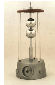
۱۵. گوی فاصله متغیر عمودی (MF)

کاربرد: برای اندازه گیری دامنه ولتاژ ضربه و تنظیم دامنه ولتاژ با الکترودهای مختلف: الکترود کروی، الکترود صفحه، الکترود سوزنی، مشخصات فنی: