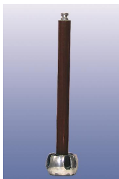
۱۱. پایه عایقی (IS)

ولتاژهای مستقیم و ضربه = 140 [kV] ظرفیت = 10000 [PF] وزن = 11 [Kg]