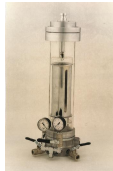
۱۶. محفظه خلاء و فشار (DKU)

کاربرد: تعیین تأثیر خلاء و فشار بر روی ولتاژ جرقه الکترودهای مختلف و مشاهده کرونا.