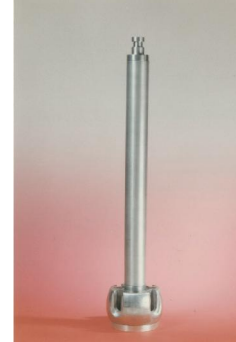
۱۲. میله اتصال (V)

کاربرد: برقراری اتصال الکتریکی بین اجزاء مجموعه مشخصات فنی: