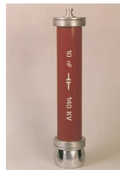
۶. خازن ضربه (CS)

ولتاژ ضربه = 140 [kV] ظرفیت = 1200 [PF] وزن = 10.5 [Kg]