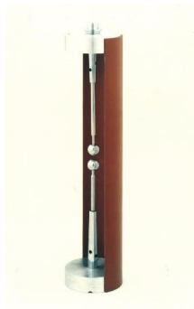
۱۷. گوی پاشن (KK)

کاربرد: به همراه محفظه فشار و خلاء جهت بررسی ثابت ماندن ولتاژ شکست دی الکتریک با ثابت ماندن حاصل ضرب فشار و فاصله بین الکترودها.