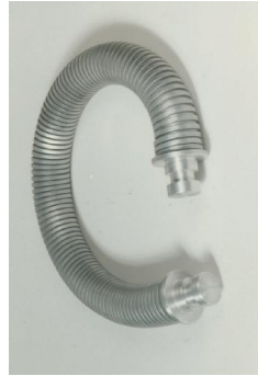
۱۳. میله اتصال خرطومی (HSV)

کاربرد: برقراری اتصال الکتریکی بین ترانسفورماتور و اجزاء مجموعه در حالت چندطبقه.