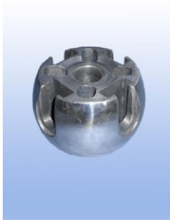
۱۴. جعبه تقسیم (K)

کاربرد: جهت ارتباط بین اجزاء مدار مشخصات فنی: