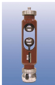
۱۰. گوی فاصله متغیر افقی (KF)

ولتاژ متناوب = 100 [kV] ولتاژ مستقیم و ضربه = 140 [kV] وزن = 1 [Kg] فنلیک = جنس طول = 63 [cm] قطر = 6 [cm]