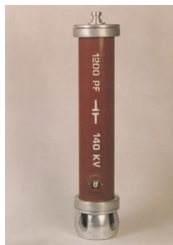
۷. خازن بار (CB)

ولتاژ متناوب = 100 [100kV] ظرفیت = 100 [PF] وزن = 10.5 [kg]