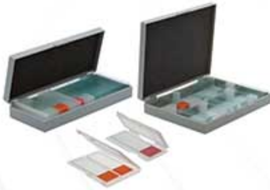
جعبه نگهداری لام و فولدر لام