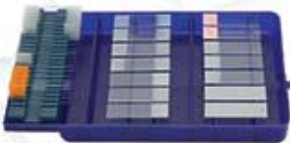
سینی رنگ آمیزی