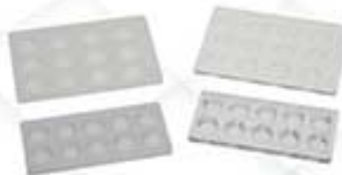
لام گوده دار ساده و سفید سرولوژی