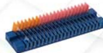
جای لام شیار دار