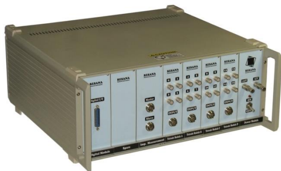
تصویر متعلق به نمونه ۱۶ کاناله است

سیستم‌های ثبت الکتروفیزیولوژی نیک تک پاسخی به تمام نیازهای شما در زمینه جمع‌آوری و ذخیره‌سازی داده‌های الکتروفیزیولوژی است. با استفاده از این سیستم امکان راه‌اندازی سیستم آزمایشگاهی علوم شناختی و انجام آزمایش‌های پارادایم کنترل امکان‌پذیر می‌باشد. در این سیستم با استفاده از الکترودهای خاصی که مستقیماً در مغز حیوانات قرار می‌گیرد، امکان ثبت فعالیت‌های نرونی (اسپایک و یا پتانسیل حوزه‌های محلی) قابل قرائت و ذخیره‌سازی است. سیستم ثبت الکتروفیزیولوژی نیک تک شامل قسمت‌های پیش تقویت کننده، کاندیشنر و مبدل آنالوگ به دیجیتال است که به منظور استفاده در محیط‌های آزمایشگاهی و تحقیقاتی طراحی شده است.