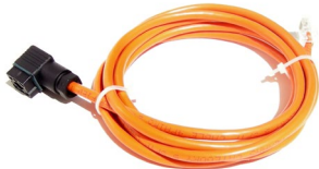
تصویر شماره ۲ - کابل فشارسنج

برای خاموش کردن دستگاه نیز آنرا از طریق کلید پشت دستگاه خاموش کنید.