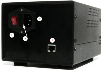
تصویر شماره ۱ - اتصالات نمایشگر

۴. محل اتصال کابل فشارسنج ( بسته به نوع مدل دستگاه متفاوت می باشد)