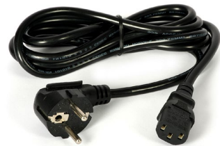
تصویر شماره ۴ - کابل برق