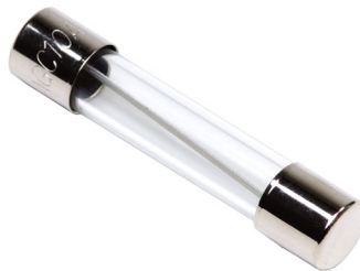
تصویر شماره ۳ - فیوز شیشه ای