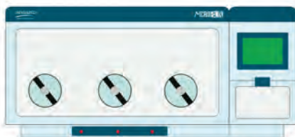
قابلیت سفارشی سازی